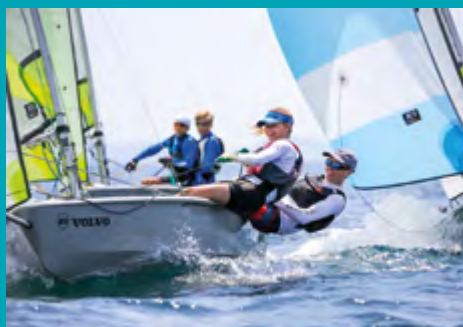
Nouveaux dériveurs RS Féva