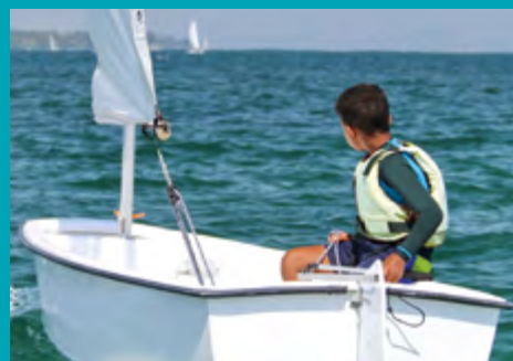
Stages d'été « Moussaillons » à partir de 4 ans

Prenez contact pour en savoir + : 07.87.70.04.15 - cnlmenthon74@gmail.com CNL (Cercle Nautique du Lanfonnet) 421, promenade du Port de Menton-saint-Bernard