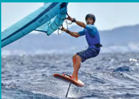
Initiation Wing Foil